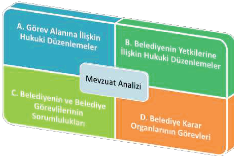
Şekil 1: Mevzuat Analizi

Bunun nedeni, belediye kanunları ile görev alanı, yetkileri ve sorumlu oldukları tespit edilmiş, 5018 sayılı Kanun ile de gelir ve gider süreci, mali işlemlerde görev alanlar ve bunların mali sorumlulukları ortaya konulmuştur.